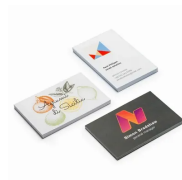
250 Biglietti da visit...