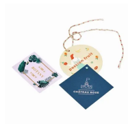
100 Stampa cartelle...