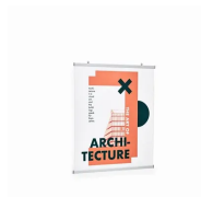
1 Banner con sostegno